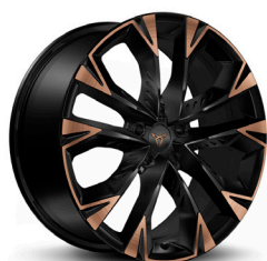
Vieglmetāla diski "Arctic Copper" R19 (Z9G)