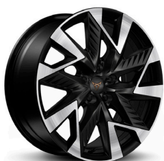
Vieglmetāla diski "Sandstorm" R19 (Z9A) (papildaprīkojums CUPRA versijai)