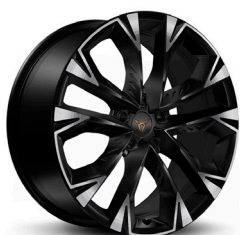
Vieglmetāla diski "Arctic" R19 (Z9C)