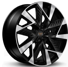
Vieglmetāla diski "Sandstorm" R19 (standartā VZ versijai)