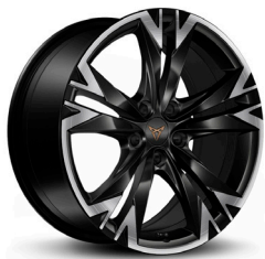
Vieglmetāla diski "Sonora" R18 (standartā CUPRA versijai)