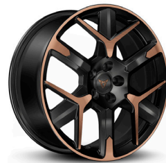
Vieglmetāla diski "Hailstorm Copper" R19 (Z9M) (standartā VZ Extreme versijai)