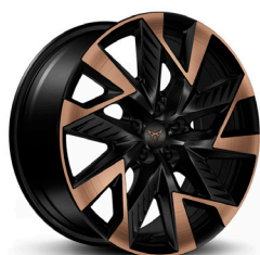
Vieglmetāla diski "Sandstorm Copper" R19 (Z9E)