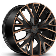
Viegļmetāla diski "Mistral Copper" R19 (R9G)