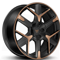
Viegļmetāla diski "Hailstorm Copper" R19 (R9M, R9N)