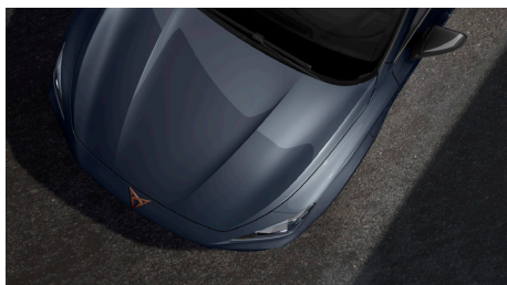
Magnetic Tech Grey (S7S7)