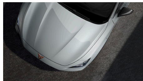
Glacial White (2Y2Y)