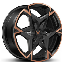
Viegļmetāla diski "Polar Copper" R19 (R9E, PD2)