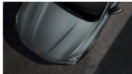
Enceladus Grey (Q7Q7)