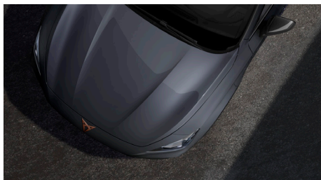
Graphene Grey (R6R6)