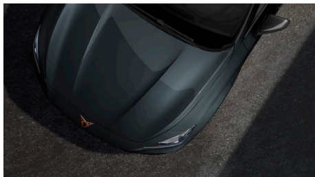
Fiord Blue (9K9K)