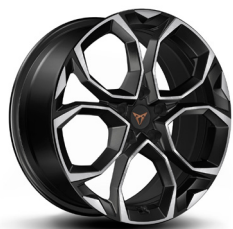
Viegļmetāla diski "Windstorm" R18 (standartā CUPRA versijai)