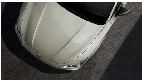
Taiga Grey (4U4U)