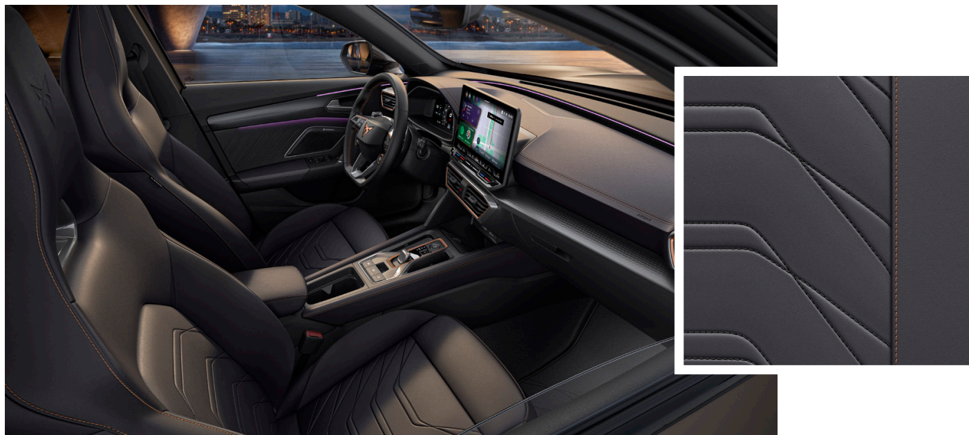
"Progressive Ambient" ādas / ādas imitācijas sēdekļu apdare (PR2)