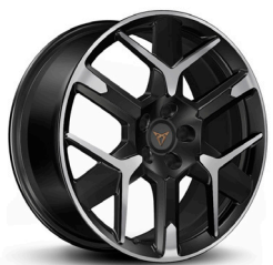
Viegļmetāla diski "Hailstorm" R19 (R9I)