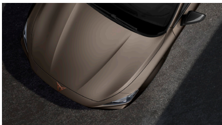
Century Bronze (L3L3)