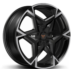
Viegļmetāla diski "Polar" R19 (PD1) (papildaprīkojums CUPRA versijai)