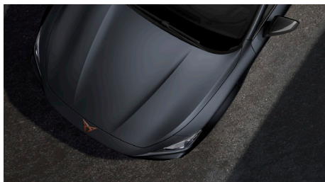
Magnetic Tech Grey (9R9R)