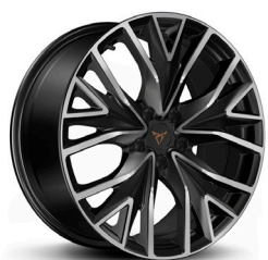
Viegļmetāla diski "Mistral" R19 (R9C)