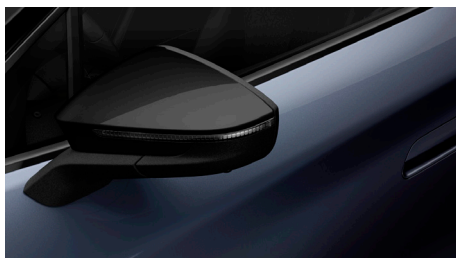
Tavascan Blue, metāliska (D9D9) (ārējie apdares elementi melnā krāsā)