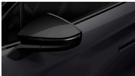
Basalt Grey (5K5K) (ārējie apdares elementi melnā krāsā)