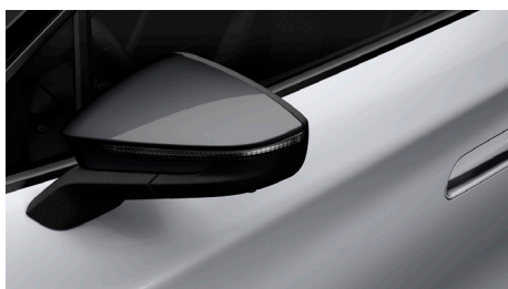
White Silver (K8K8) (ārējie apdares elementi pelēkā krāsā)