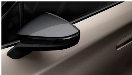
Atacama Desert, metāliska (1B1B) (ārējie apdares elementi pelēkā krāsā)